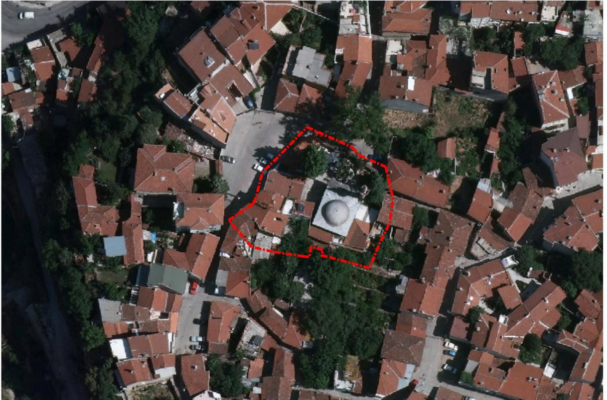
Resim 1: Alana ilişkin uydu görüntüsü

Plan değişikliğine konu alan yaklaşık 225 m 2 olup, parseller özel mülkiyetinden oluşmaktadır. Söz konusu alan Osmangazi İlçesi, Alaaddin Mahallesinde, Ali Osman Sönmez Onkoloji Devlet Hastanesinin 385 mt. güney batısında, Tophane Endüstri Meslek Lisesinin 345 mt. güney doğusunda, Alaaddin Camii Caddesinde yer almaktadır.